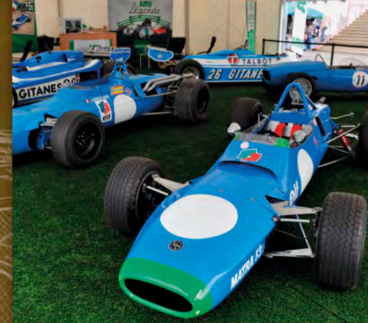
RENÉ BONNET 50 ANS p. 4