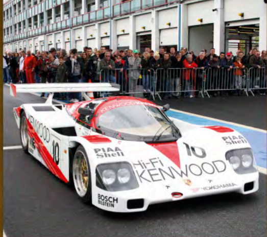
SENSATIONS EN PISTE p. 2