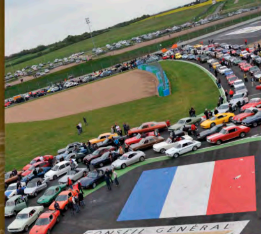
CLASSIC PÉRIPH' p. 2