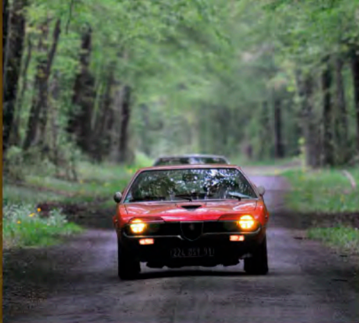
BUCOLIQUE À SOUHAIT p. 4